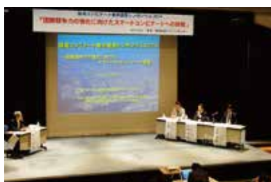
臨海コンビナート都市連携シンポジウム