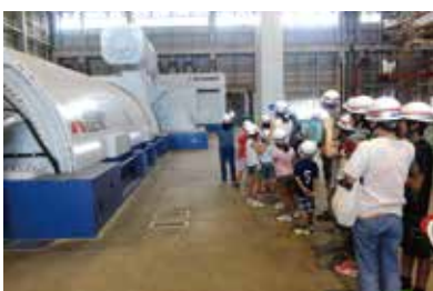
臨海コンビナート親子見学会