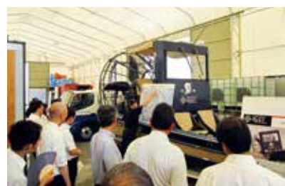
首都圏臨海防災センター視察