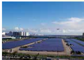
浮島太陽光発電所