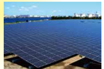
扇島太陽光発電所