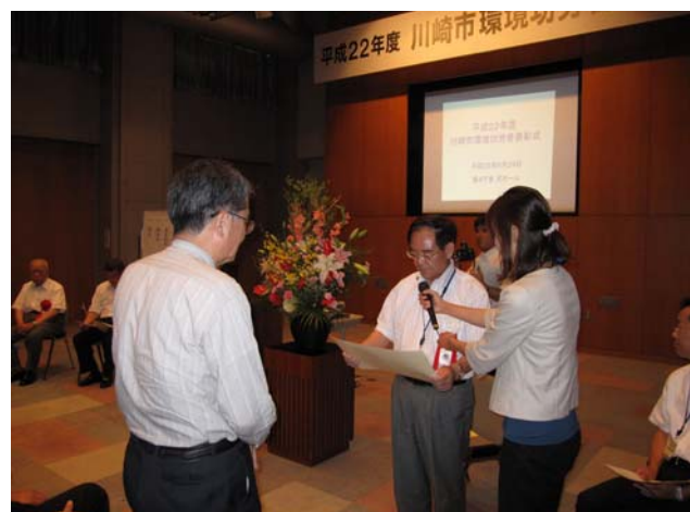
川崎市長から表彰状を授与